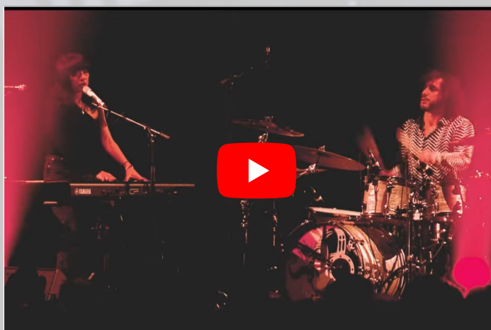
ZOMBii ( Live )